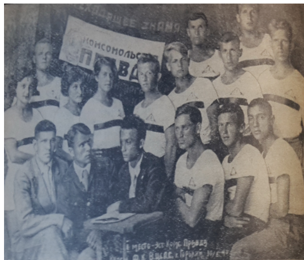
Фотография победителей спортивной эстафеты, завоевавших переходящее знамя «Комсомольской правды». 1940 год.