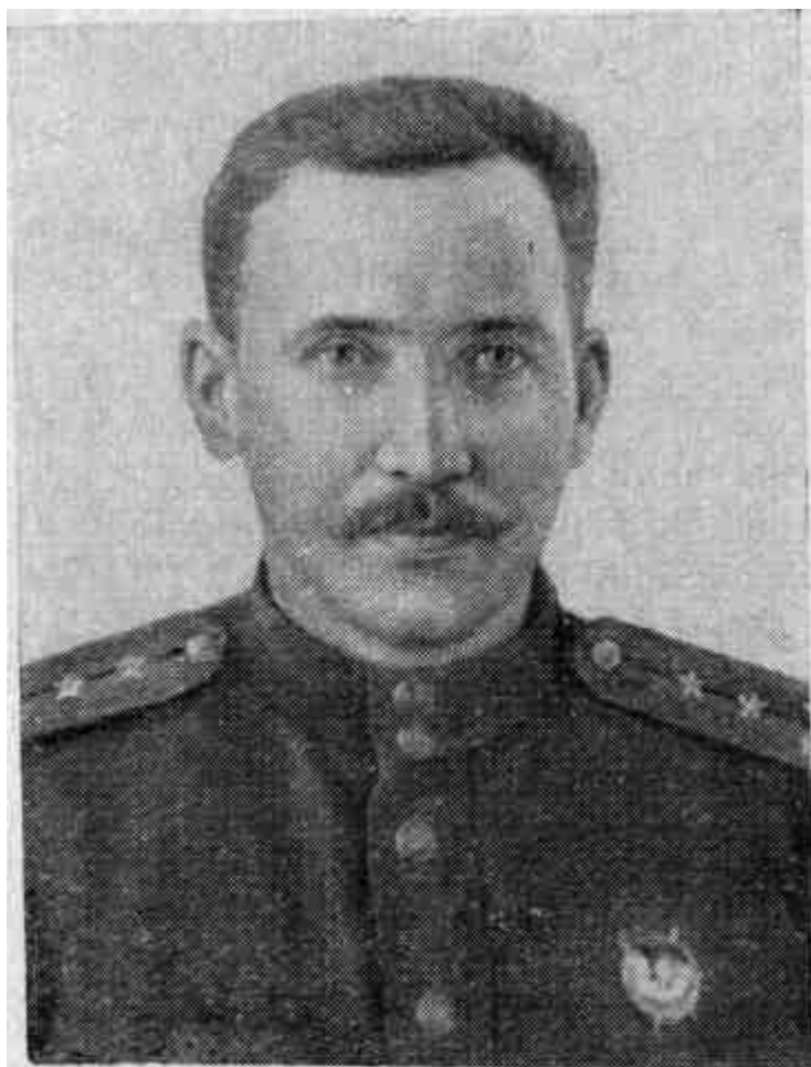
Последняя фотография Юрия Двужильного. Апрель 1944 г.