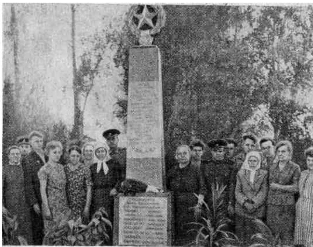
Родные и близкие погибших воинов у памятника на братской могиле.