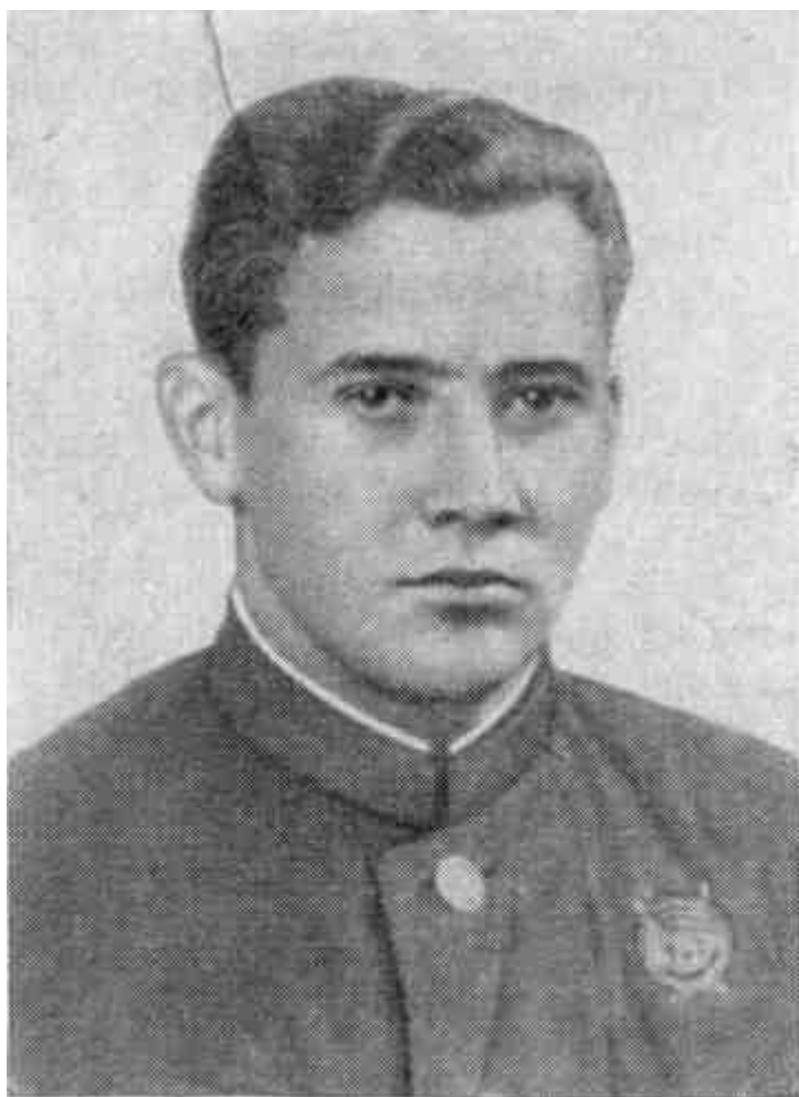
Юрий Двужильный в 1940 г.

Кто же они, эти герои? Кому вечная слава? Я спрашиваю об этом у местных жителей, но часто они ничего не знают о погибших воинах. И объясняется это просто: когда в этих местах шли ожесточенные бои, местные жители прятались в окрестных лесах, на болотах. Когда же фронт уходил дальше и жители возвращались в свои села, где-нибудь на окраине уже была братская могила — свежий песчаный холмик, деревянный, сделанный наспех обелиск с короткой надписью: «Вечная слава героям...»